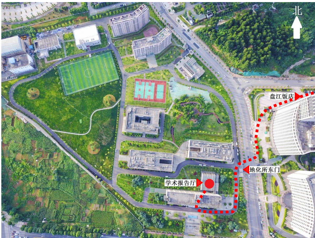
图中红色虚线即为酒店（盘江饭店）↔地化所学术报告厅之间行走路线